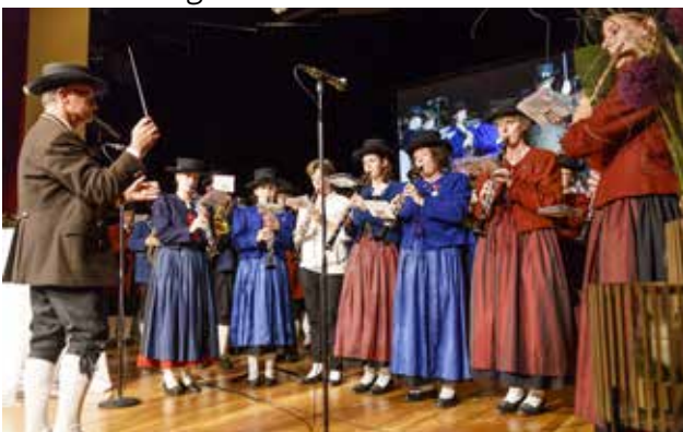
Gemeindemusikkapelle beim Städtebundtag in Feldkirch

Eine kurze Zusammenfassung über die Tätigkeit des Landeskapellmeisters im abgelaufenen Verbandsjahr: Konzertbesuche, diverse Besprechungen, Sitzungen VBV, Festakte, Vertretung im Prima la Musica-Fachbeirat, Dirigenten Fortbildung, Landeskapellmeister-Konferenzen ÖBV, Landeswertungsspiele, Gesamtchordirigante, Jänner bis September 2018 – 52 Mal für den VBV unterwegs.