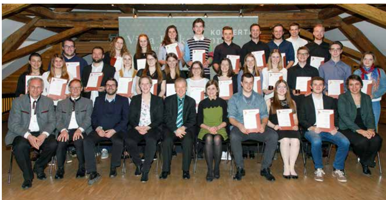
Urkundenübergabe Oberstufenprüfung und Gold-Abzeichen-Überreichung

*Die außerordentlichen Vereine sind von Pflichten befreit und haben bei Bezirks- und Generalversammlung kein Stimmrecht.