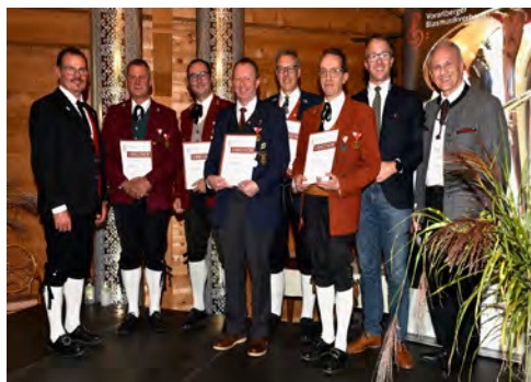
Bezirk Bludenz - 40