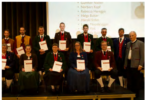
Bezirk Bregenzerwald - 25