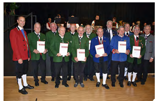
Bezirk Dornbirn - 50/60