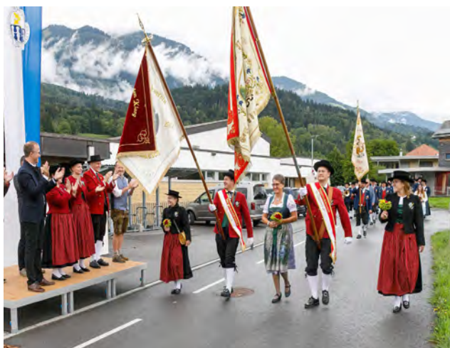
Fahnenweihe BMV Bludesch