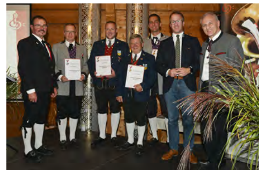
Bezirk Bludenz - ÖBV Silber/Gold