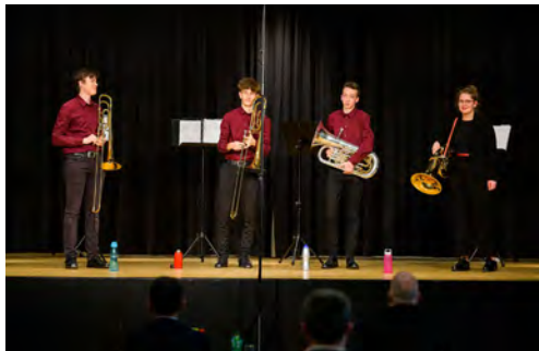
Low Brass "ANMATOMA"