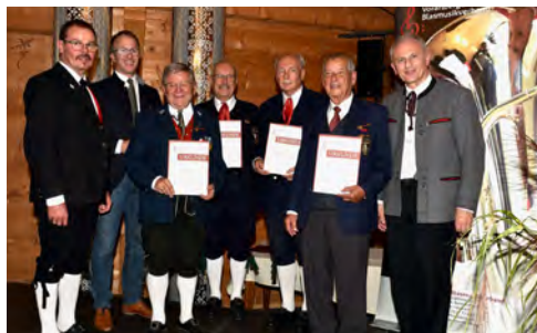
Bezirk Bludenz - 60/70