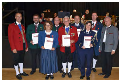
Bezirk Dornbirn - 25