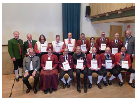
Bezirk Bregenz - 40/50/60/ÖVB Gold