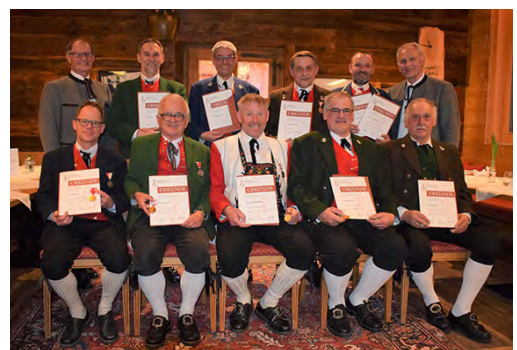
Bezirk Bregenzerwald- 40/Kpm.EZ 20