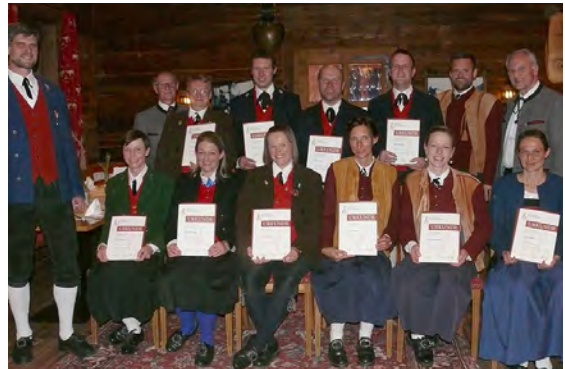
Bezirk Bregenzerwald - 25