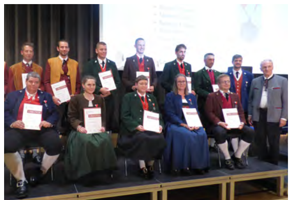
Bezirk Bregenzerwald - 25