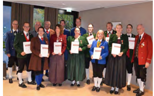
Bezirk Felkdirch - 25