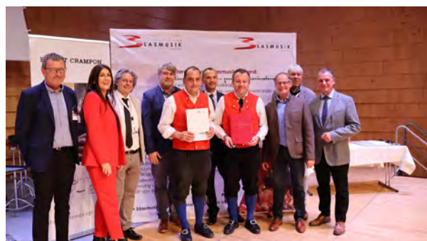
Gratulation der BM AU zum erfolgreichen Auftritt beim Bundeswettbewerb der Stufe D am 8.10.2022

an alle Mitstreiter im Bezirksausschuss für die kameradschaftliche Zusammenarbeit, Ergreifung eigener Initiativen und Erledigung der übernommenen Aufgaben, der Landesleitung für die Zusammenarbeit und Unterstützung unserer Bezirksvorhaben.