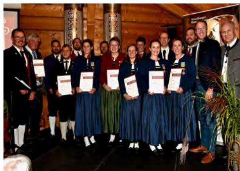
Bezirk Bludenz -25