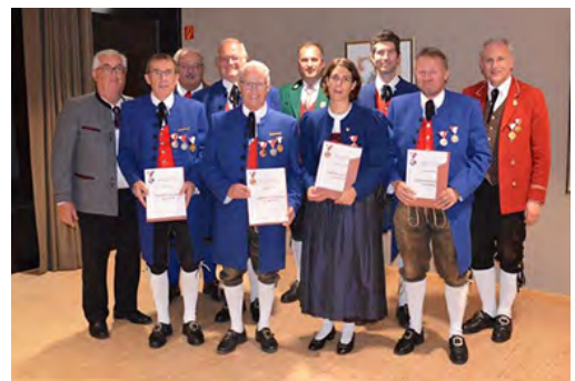
Bezirk Felkdirch ÖBV Bronze/Silber/Gold