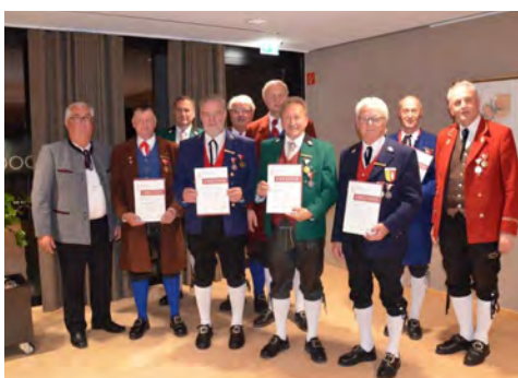
Bezirk Feldkirch - 50