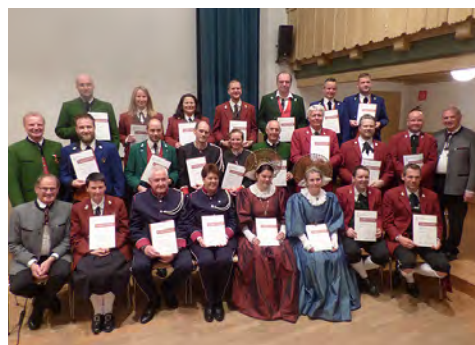
Bezirk Bregenz - 25