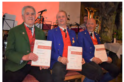
Bezirk Bregenzerwald - 50/60