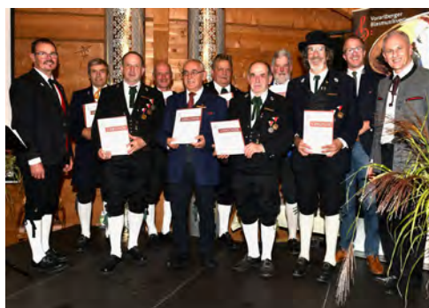
Bezirk Bludenz -50