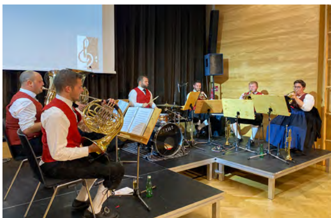
Bezirk Bregenzerwald „Buch Brass“