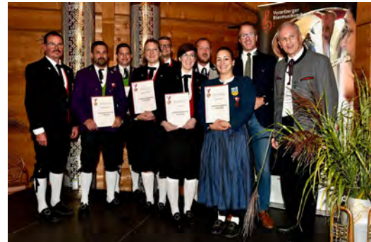
Bezirk Bludenz - ÖBV Bronze