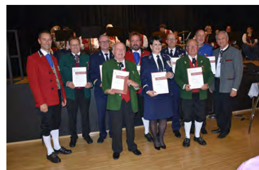
Bezirk Dornbirn - 40