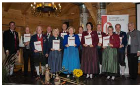
Bezirk Bludenz - 25