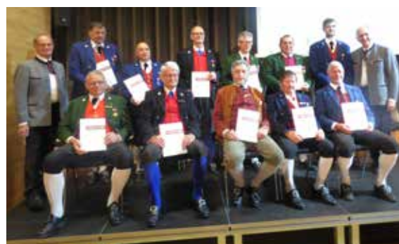
Bezirk Bregenzerwald - 40/ 50/60