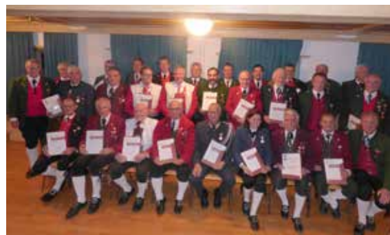
Bezirk Bregenz - 40/50/60