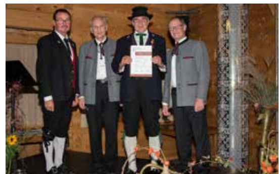
Bezirk Bludenz - VBV