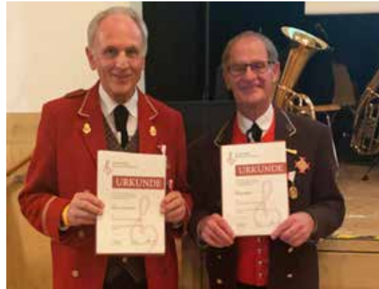
Bezirk Bregenz - 40/50