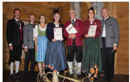
Bezirk Bludenz - ÖBV