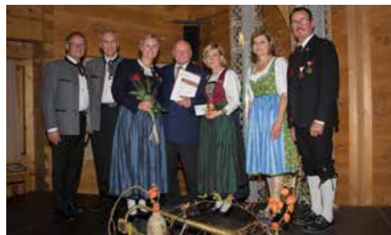
Bezirk Bludenz - 70