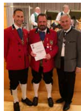
Bezirk Dornbirn ÖBV