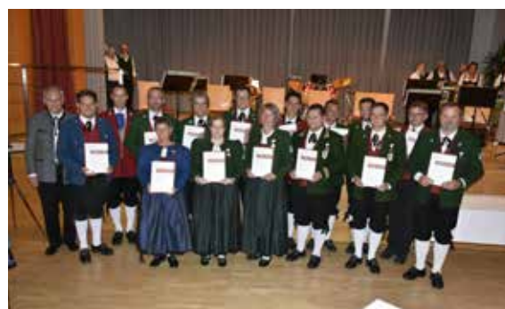
Bezirk Dornbirn - 25