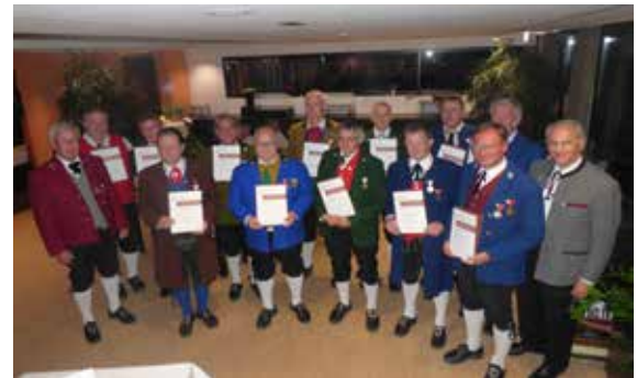
Bezirk Feldkirch - 50/60