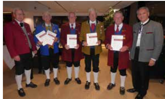
Bezirk Feldkirch - 60