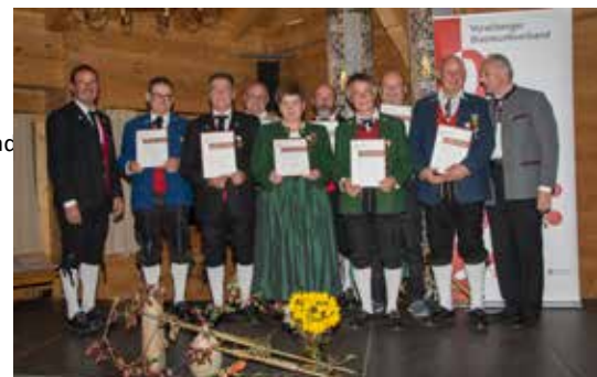
Bezirk Bludenz - 50