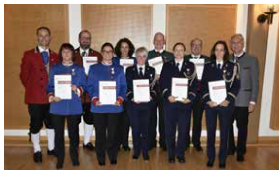
Bezirk Dornbirn - 25