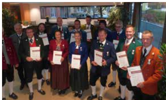
Bezirk Feldkirch - 25