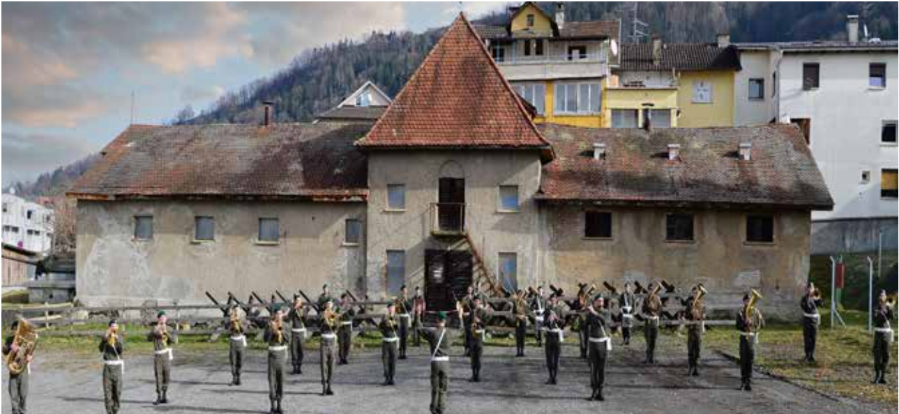
Der ehemalige Rossstall in der Bilgeri-Kaserne in Bregenz wird mit Zubau ein Musikcenter für die Militärmusik Vorarlberg und andere Orchester sowie für Fortbildungsveranstaltungen des Vorarlberger Blasmusikverbandes