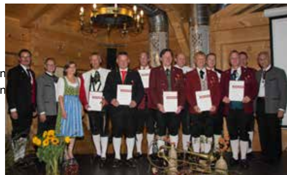
Bezirk Bludenz - 40