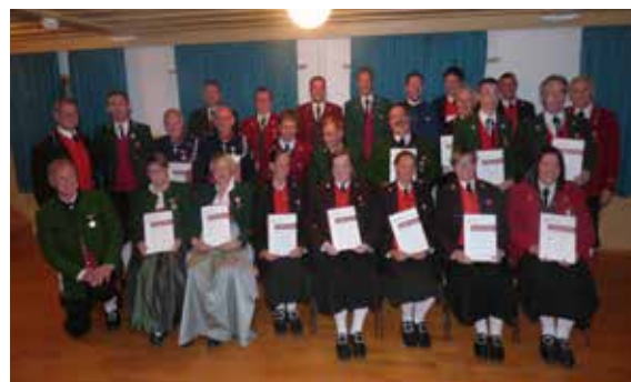
Bezirk Bregenz - 25