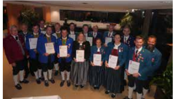
Bezirk Feldkirch - ÖBV