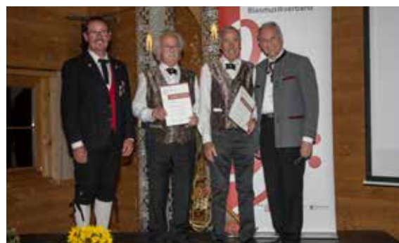
Bezirk Bludenz - 60