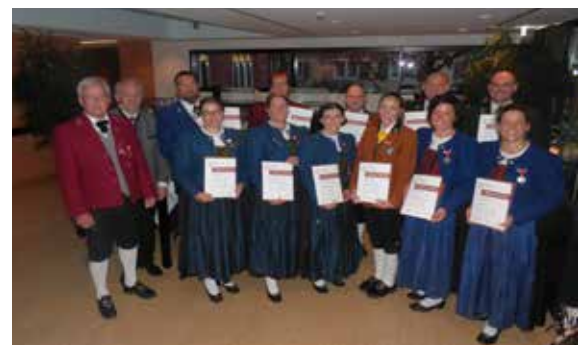
Bezirk Feldkirch - 40