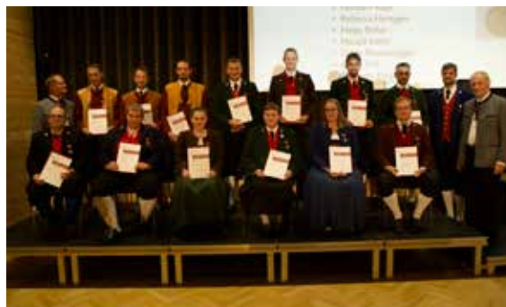
Bezirk Bregenzwald - 25