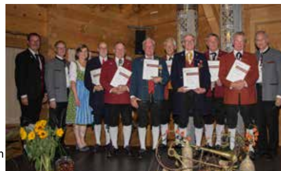
Bezirk Bludenz - 50