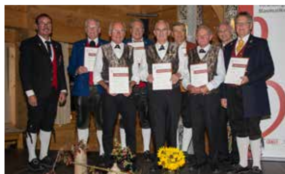
Bezirk Bludenz - 50