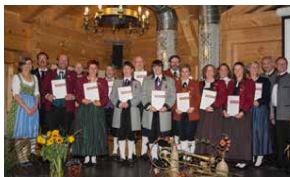
Bezirk Bludenz - 25