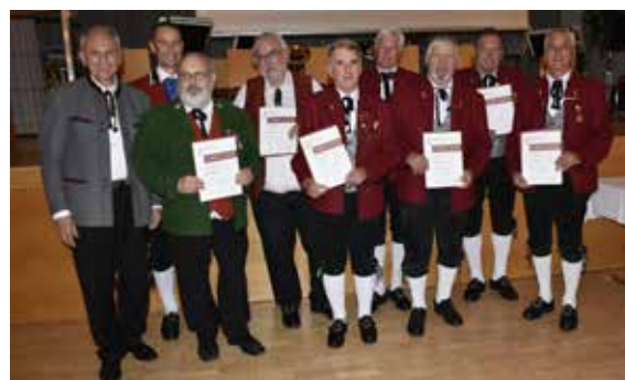
Bezirk Dornbirn - 50/60