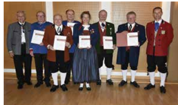
Bezirk Dornbirn - 40