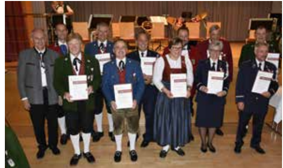
Bezirk Dornbirn - 40