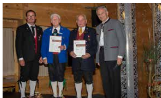
Bezirk Bludenz - 70