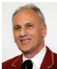
Landesobmann Wolfram Baldauf